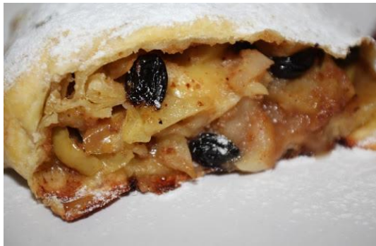
Штрудель — відомий австрійський десерт, що складається з тонких шарів смаженої випічки з начинкою з яблук і родзинок.