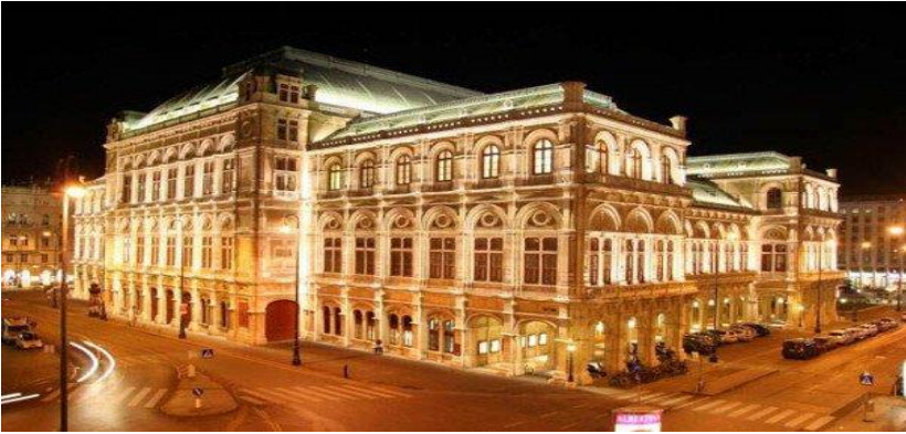
Віденська державна опера