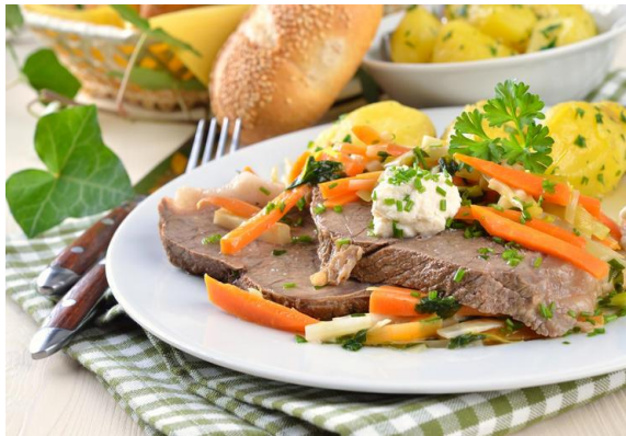
Tafelspitz – варена яловичина з картоплею і хріном