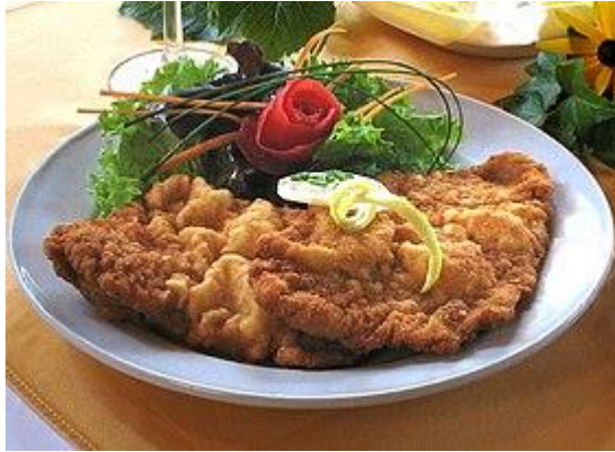
Віденський шніцель — смажена відбивна з яловичини в хлібному паніруванні.