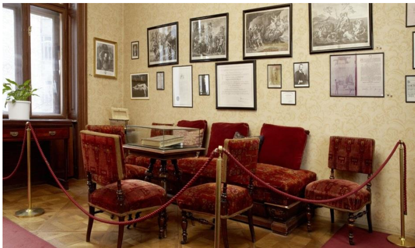
Музей Зигмунда Фрейда