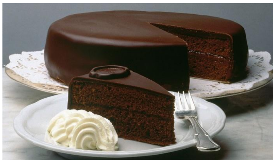
Захер — легендарний шоколадний торт.