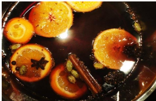
Gluhwein – гаряче червоне вино з апельсином і спеціями.