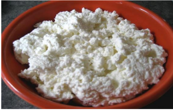
Ліптауер – блюдо з вершкового сиру з паприкою.