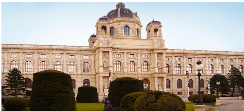
Музей історії мистецтва