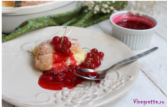
Salzburger Nockerln – запечене ванільне суфле.