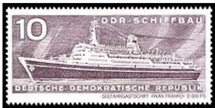
Пасажирський лайнер «Іван Франко»

Восьмипалубне судно будувалося на верфі VEB Mathias Thesen Werft Wismar у Вісмарі, проєкт 301, німецьке позначення — Seefa 750 (нім. Seefahrtgastschiff für 750 Passagiere — морське пасажирське судно на 750 пасажирів) [87] . Всього було побудовано п'ять лайнерів цього проєкту: «Іван Франко», «Олександр Пушкін», «Тарас Шевченко», «Шота Руставелі», «Михайло Лермонтов». Судно «Іван Франко» було головним, тому весь клас суден має ім'я «Іван Франко».