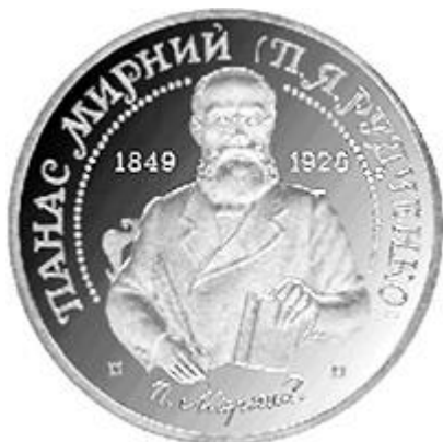
Ювілейна монета НБУ «Панас Мирний» номіналом 2 гривні. Реверс