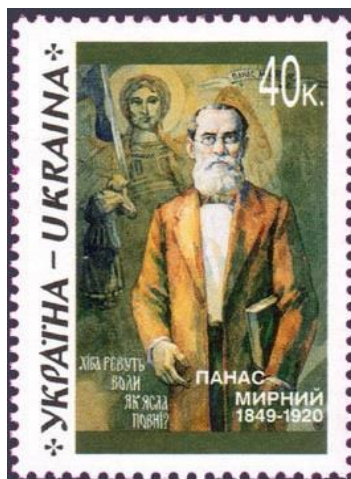
Поштова Марка "Панас Мирний"