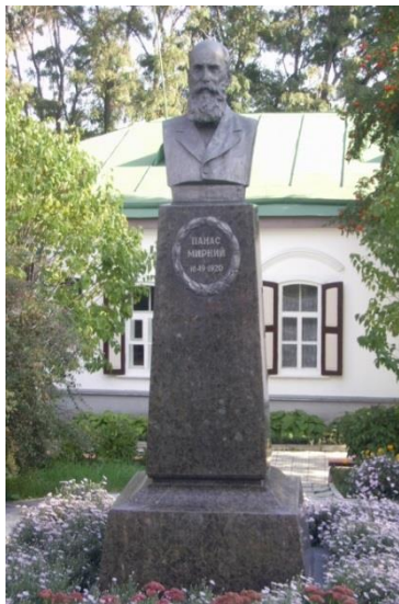
Бюст близ меморіального музею в Полтаві.