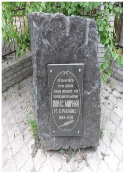
Пам'ятна плита на місці, де народився і жив Панас Мирний